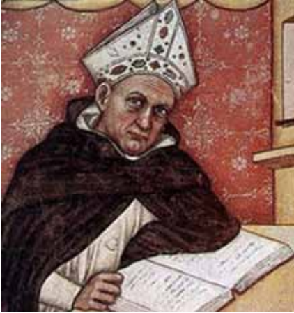
Heilige Albertus Magnus

Wij kennen in het Westen o.a. de leringen van de heilige Albertus Magnus, Jakob Böhme, Nicolas Flamel en mystieke leringen van enkele ridderorden.