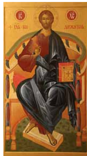
Christus de Alheerser

Door deze oefening wordt het innerlijk gereinigd, en dan begint de God - Drieëenheid in het hart van de beoefenaar te vertoeven. Deze oefening kent echter veel gevaren en obstakels en het wordt in het algemeen niet aanbevolen om hieraan te beginnen zonder een ervaren geestelijke leider, zonder het beoefenen van nederigheid en gehoorzaamheid en het bestuderen van de Heilige Schrift en de werken van de beoefenaars van deze praktijk, zoals de heilige Gregorios van de Sinaïberg, de heilige Gregorios Palama, de heilige Niciforos de Vaster, de heilige Paissios Velichkovski, de heilige Serafim van Sarov en anderen.